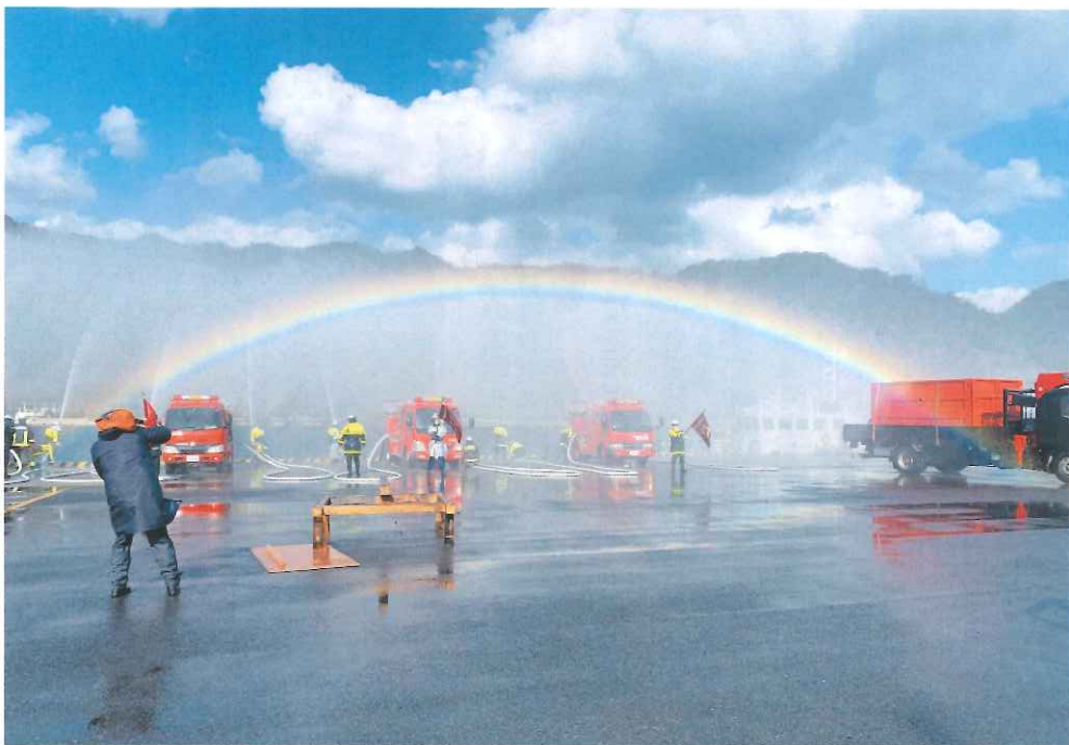
令和6年 境港市消防出初式